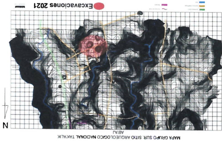
Imagen 1. Mapa del Grupo Sur mostrando las áreas en donde se llevaron a cabo las investigaciones durante el 2021 (MICUDE-DGPCN/IDEAH/PANTA, 2021)

El análisis general hasta el momento nos indica que la industria más utilizada en Tak'alik Ab'aj es la de la navaja prismática (Ver gráfica 1), y que la fuente empleada por excelencia sigue siendo la procedente de El Chayal (Ver gráfica 2).